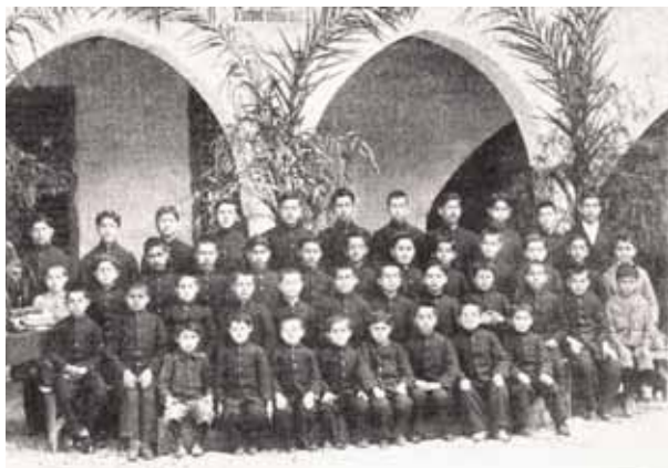
● Οι μαθητές του ορφανοτροφείου του Βαχάν Κιουρκτζιάν (1899).