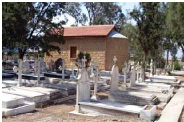
• Το παρεκκλήσι της Αγίας Αναστάσεως στο κοιμητήριο του Αγίου Δομετίου (2010).