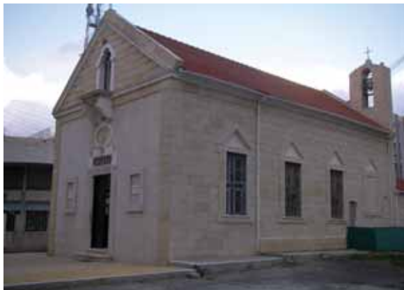
● Η εκκλησία του Αγίου Στεφάνου στη Λάρνακα (2009).

Εκ φύσεως νομοταγείς, οι Αρμενοκύπριοι πάντοτε είχαν υψηλή προφίλ με τη βρετανική διοίκηση και πολλοί έγιναν ευσυνείδητοι δημόσιοι λειτουργοί και πειθαρχημένοι αστυνομικοί ή εργοδοτούνταν στον Κυπριακό Κυβερνητικό Σιδηρόδρομο και την “Cable and Wireless”. Κατά τις δεκαετίες 1920-1950, πολλοί εργάζονταν στα μεταλλεία αμιάντου στον Αμιάντο και στα μεταλλεία χαλκού στο Μαυροβούνι και τη Σκουριώτισσα, μερικοί από τους οποίους υπήρξαν συνδικαλιστές. Κάποιοι