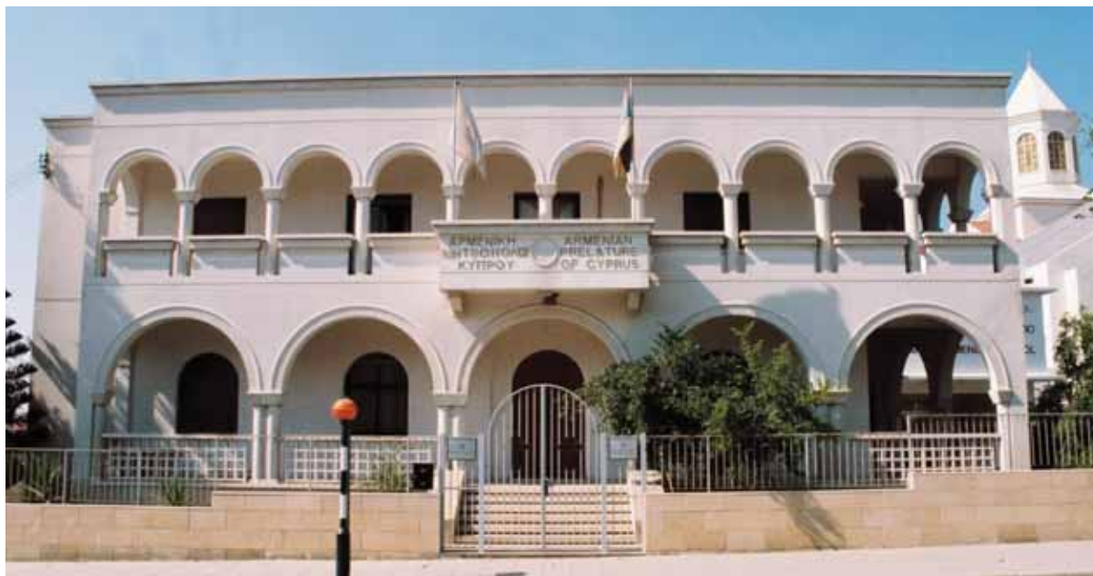
● Η Αρμενική Μητρόπολη (2003).

Το Καταστατικό της Μητρόπολης αποτελείται από 102 άρθρα και, στην παρούσα μορφή του, ισχύει από το 2010. Τη διοίκηση ασκεί η Αρμενική Εθναρχία (Αζκαίν Ισχανουτιούν) μέσω του Θρονικού Συμβουλίου (Τεμαγκάν Ζιογόβ) και του Εκτελεστικού Συμβουλίου (Βαρτσιαγκάν Ζιογόβ). Υπάρχουν, επίσης, τοπικές ενοριακές επιτροπές (Λευκωσία, Λάρνακα, Λεμεσός), η επιτροπή χριστιανικής κατήχησης και η επιτροπή κυριών. Η Μητρόπολη λαμβάνει ετήσια χορηγία από την Κυβέρνηση.