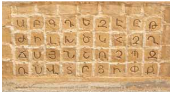
• Το μνημείο για το Αρμενικό Αλφάβητο στο Ινστιτούτο Μελκονιάν.