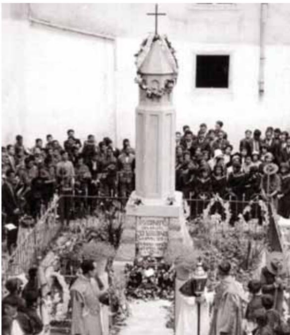
● Επιμνημόσυνη τελετή για την Αρμενική Γενοκτονία μπροστά από το παλιό Μνημείο της Γενοκτονίας με τον Επίσκοπο Γεβόντ Τσεμπεγιάν (1948).

Εκ φύσεως νομοταγείς, οι Αρμενοκύπριοι πάντοτε είχαν υψηλή προφίλ με τη βρετανική διοίκηση και πολλοί έγιναν ευσυνείδητοι δημόσιοι λειτουργοί και πειθαρχημένοι αστυνομικοί ή εργοδοτούνταν στον Κυπριακό Κυβερνητικό Σιδηρόδρομο και την “Cable and Wireless”. Κατά τις δεκαετίες 1920-1950, πολλοί εργάζονταν στα μεταλλεία αμιάντου στον Αμιάντο και στα μεταλλεία χαλκού στο Μαυροβούνι και τη Σκουριώτισσα, μερικοί από τους οποίους υπήρξαν συνδικαλιστές. Κάποιοι