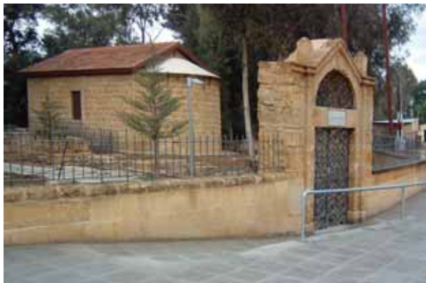
• Το παρεκκλήσι του Αγίου Παύλου και η εντυπωσιακή πύλη του παιλιού αρμενικού κοιμητηρίου στη Λευκωσία (2010).