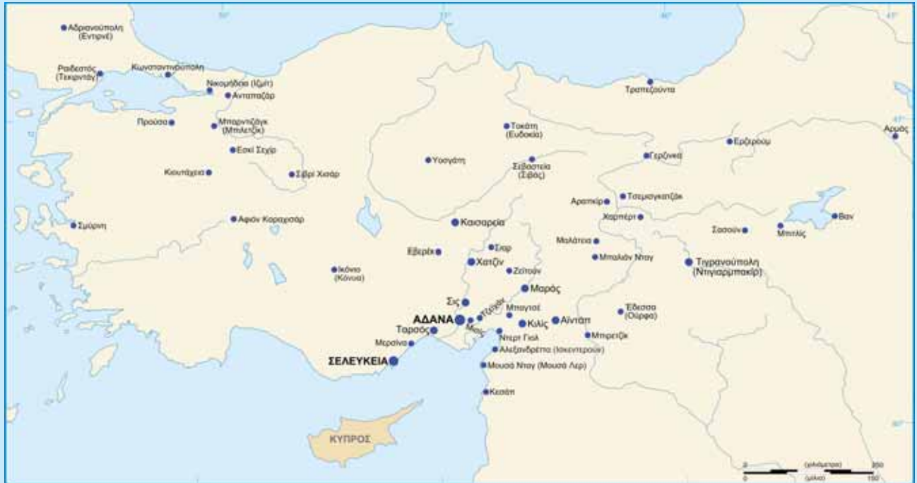
Χάρτης με τους τόπους προέλευσης των Αρμενοκυπρίων

Σχεδιασμός του χάρτη από τον Αλέξανδρο-Μιχαήλ Χατζηήφρα