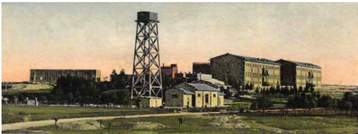
● Ταχυδρομικό δελτάριο που απεικονίζει το νεόκτιστο Εκπαιδευτικό Ινστιτούτο Μελικιάν (1926).

Γενοκτονία που διέπραξαν οι Οθωμανοί και οι Νεότουρκοί (1894-1896, 1909 και 1915-1923). Η Κύπρος άνοιξε απλόχερα τις αγκάλες της για να υποδεχθεί πέραν των 10.000 προσφύγων από την Κιλικία, τη Σμύρνη και την Κωνσταντινούπολη, οι οποίοι κατέφθασαν στη Λάρνακα και σε όλα τα άλλα λιμάνια, κάμποι από τύχη, άλλοι από πρόθεση· περίπου 1.500 από αυτούς έκαμαν την Κύπρο την καινούργια τους πατρίδα. Εργατικοί, καλλιεργημένοι και φιλοπρόδοι, έφεραν μια νέα πνοή στην παλιά