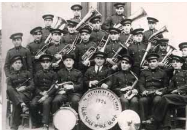
● Η διάσημη Φιλαρμονική του Σχολείου Μελικιάν (1930), που ιδρύθηκε από το φημισμένο μουσικό Βαχάν Μπετελιάν το 1926. Ο εξόριστος Βασιλιάς της Αραβίας, Χουσεΐν μπιν Αλί, δώρισε καινούργια μουσικά όργανα σε αυτήν το 1927.