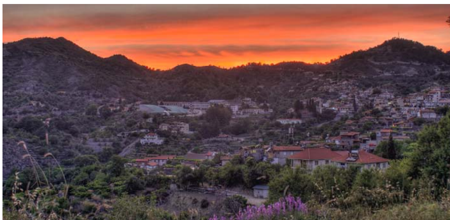
Agros i Troodosbergen, Cypern.

Medelhavskosten har uppstått genom den unika livsstil som klimatet i regionen bidrar till och förekommer i kulturella sammanhang, vid festivaler och festligheter. Där blir den ett uttryck för ömsesidigt erkännande och ömsesidig respekt, gästfrihet, grannsämja, gemytlighet, överföring mellan generationerna och interkulturell dialog.