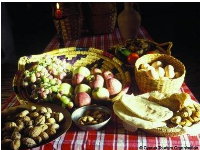
Medelhavskosten baseras huvudsakligen på grönsaker, nötter, baljväxter, olivolja och fisk.

Den mellanstatliga kommittén för skydd av det immateriella kulturarvet beslutade den 4 december att skriva in Medelhavskosten på Unescos representativa förteckning över mänsklighetens immateriella kulturarv.