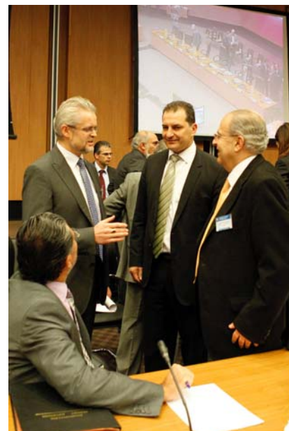
Energiminister Lakkotrypīs, andra från höger, deltog också i EC-konferensen.